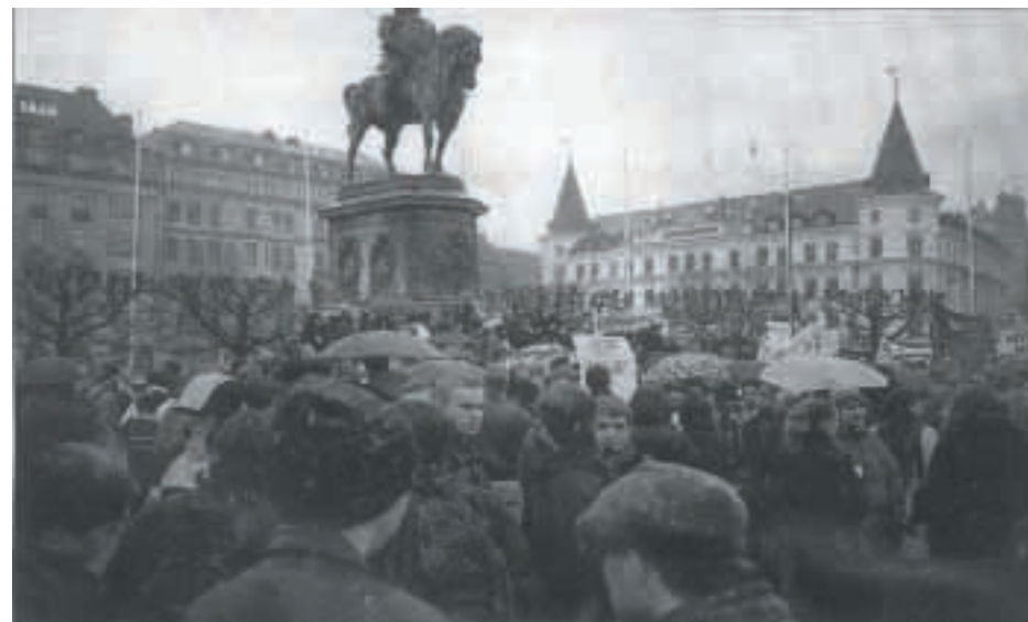
Skolstrejk i Malmö 1999

Och även om tjejerna under skolan är »duktiga« och får bättre betyg i genomsnitt, värderas deras kunskap ändå lägre när de sedan kommer ut i arbetslivet. Där fortsätter trakasserierna, och de kommer att få sämre jobb med sämre lön.