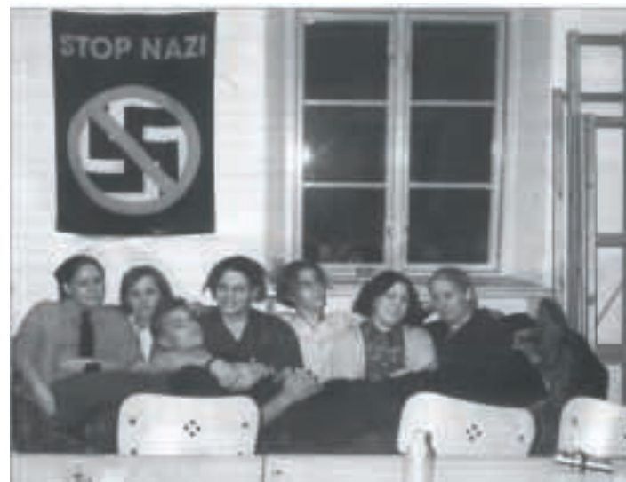
Elevsyndikat i Västerås 1998

Vi som har skrivit det här häftet kan inte avgöra vad som är det bästa sättet för syndikalister att föra elevkamp i dagens skola. Radikala ungdomar har på vissa håll i landet kunnat verka inom elevrådet och elevorganisationen, i andra fall har man valt strejkkommittéer, fristående skolfack eller SUF-anknutna skolgrupper för att agera. Det enklaste är att se hur förutsättningarna ser ut på din skola.