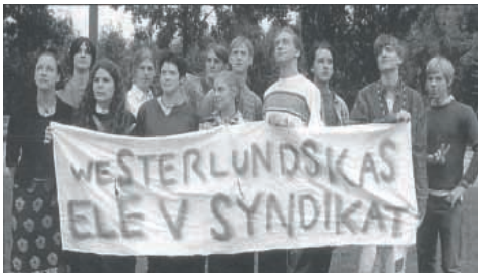
Elevsyndikat i Enköping 1997