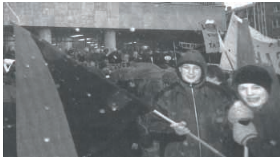
Skolstrejk i Malmö 1999

Det finns fler liknande maktförhållanden, fler grupper som är underordnade därför att de inte anses vara »normala«. Till exempel homo- eller bisexuella, fysiskt eller psykiskt handikappade och så vidare.